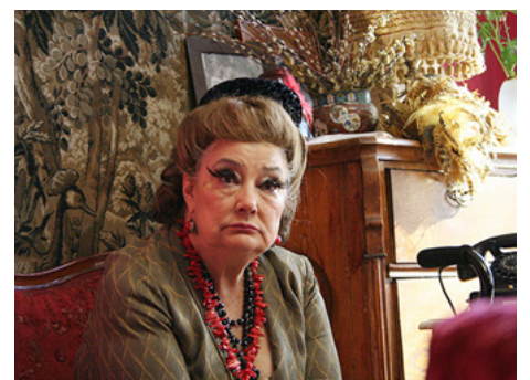
2008 NIRVANA (Nirvana) d'Igor Voloshin