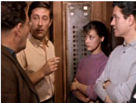
1960 VINGT MILLE LIEUES SUR LA TERRE de M. Pagliero avec L. Zitrone, J. Rochefort, J. Gaven