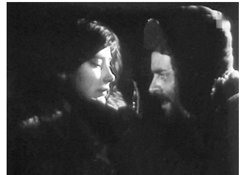
1964 MARCHER OU MOURIR (Italiani brava gente) de Giuseppe De Santis avec Andrea Checchi