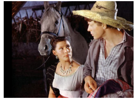
1955 LE MEXICAIN (Meksikanets) de Vladimir Kaplounovski avec Oleg Strizhenov