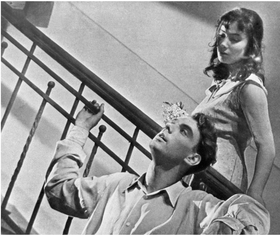
1957 QUAND PASSENT LES CIGOGNES (Letyat zhuravli) de Mikhaïl Kalatozov avec Alexeï Batalov