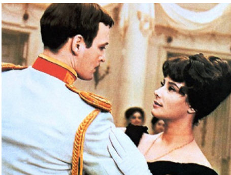
1967 ANNA KARÉNINE (Anna Karenina) d'Alexandre Zarkhi avec Vassili Lanvoi